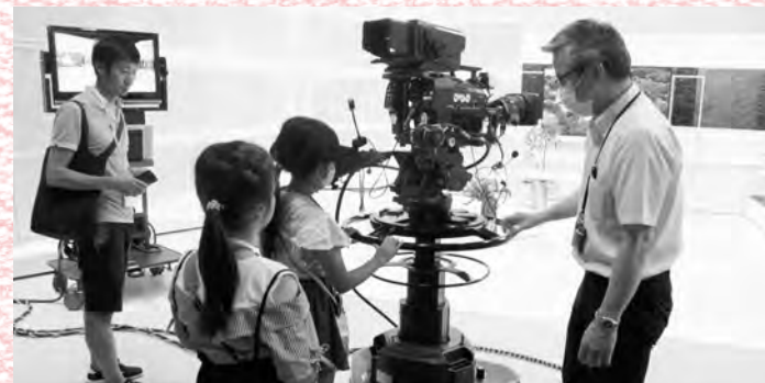
*写真は昨年実施時の様子